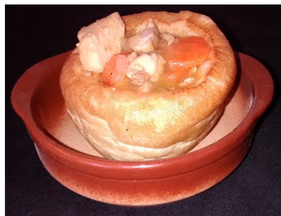
Cazuela de Slachichas en pudin de Yorkshire