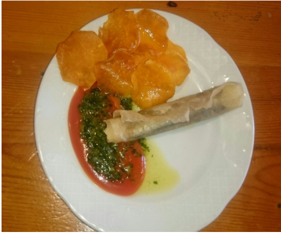
Crujiente de Boquerón