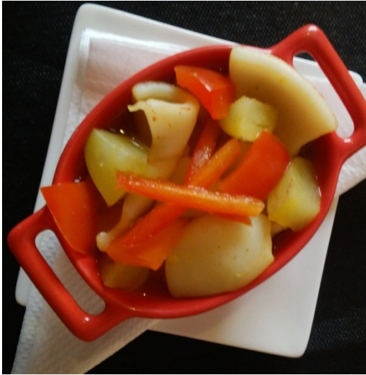
Caldereta de Pescado