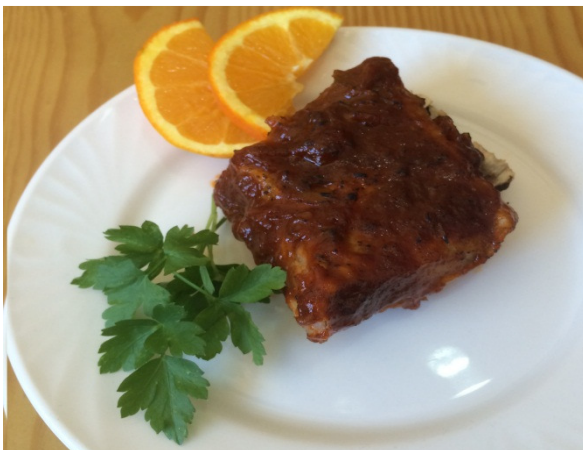
Costillas de Fuego