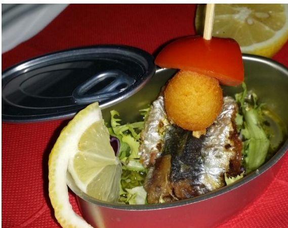
La Latica de La Abuela