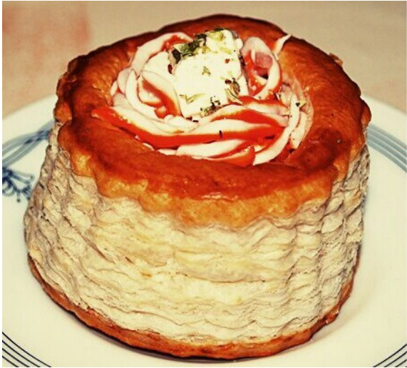
Sinfonía del Mar