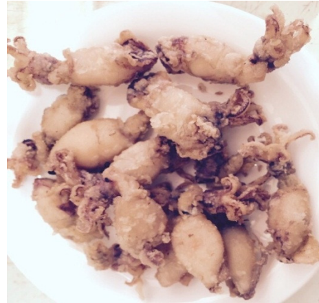
Paella de Marisco o Chipirones