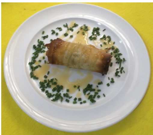
Rollito "Rincón de Morales"