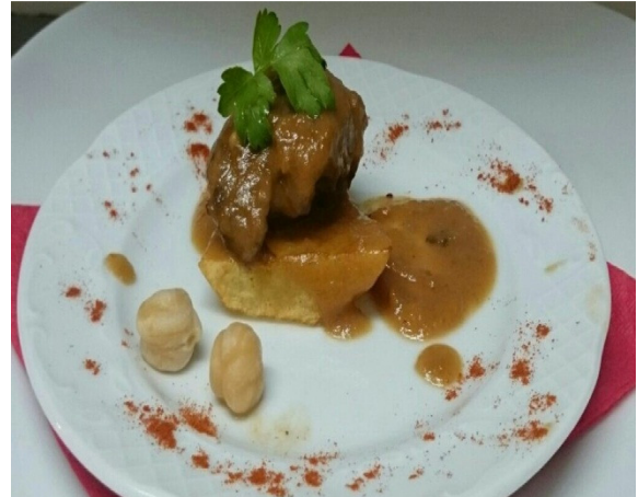
Carrillera con Salsa de Verdura