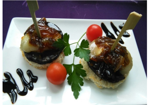
Pincho de Morcilla Dulce