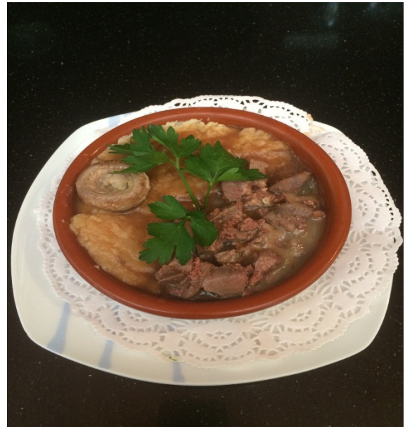
Stuffed Mushooms with meat and Bechamel sauce