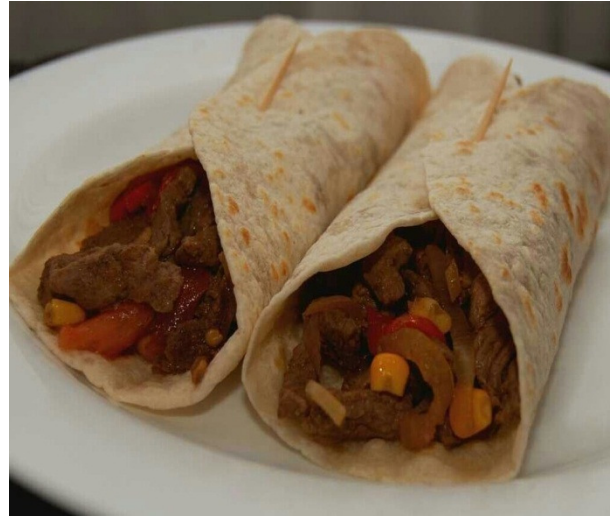
Tex Mix ``El Paso