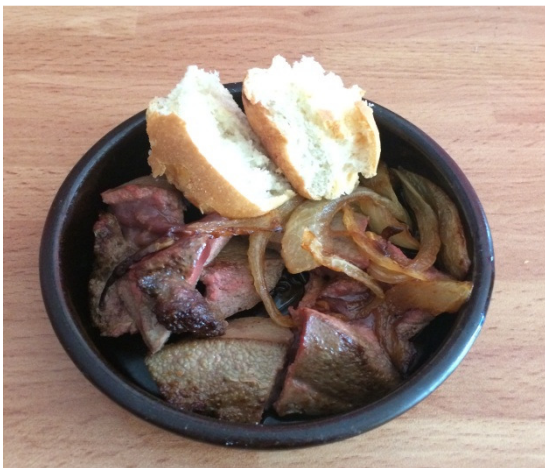
Higado y Cebolla