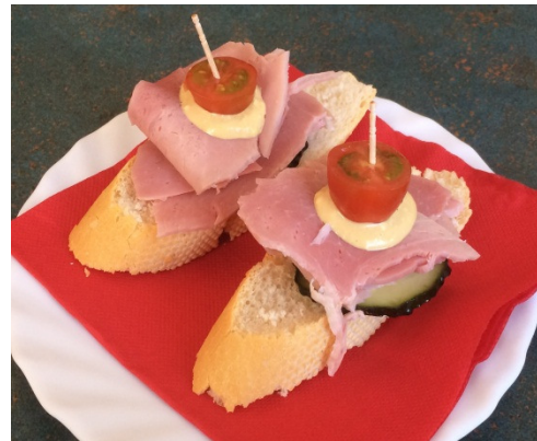
Pincho de Lomo Asado