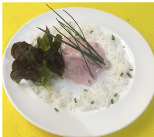
Tartaletas rellenas de Ragut de pescado