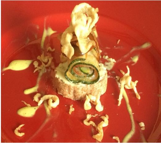
Alteza de Calabacín al Queso