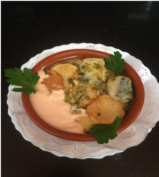
Fish+Prawns with a creame sauce and potatoes