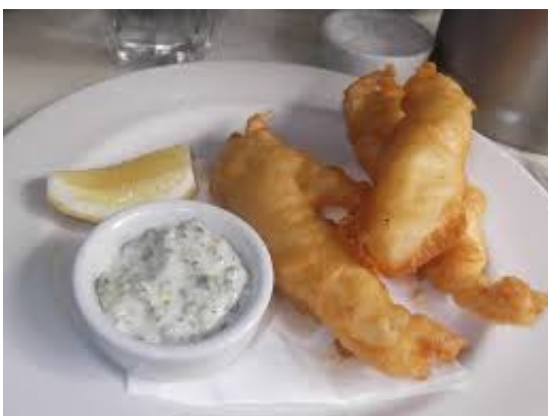
COD Goujons/ Goujons de Bacalao