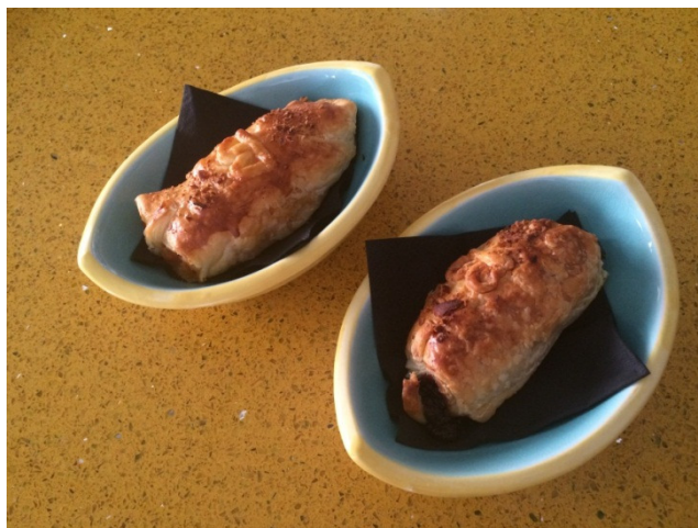
El Especial del Buscavidas