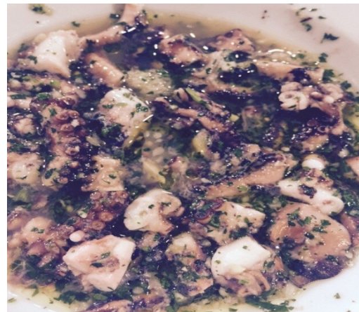
Paella de Conejo o Pulpo